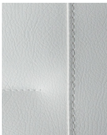
CLAY Skinnimitation (tillval)