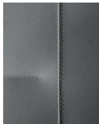
SVART Skinnimitation (ingår i Premium-paketet)